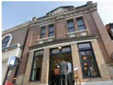
パーラートチギ外観