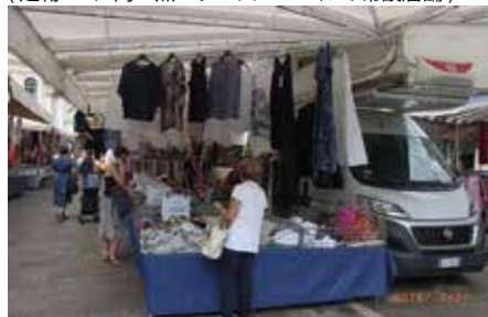
シニョーリ広場の朝市(生活を支える各種商品)

北イタリア・パドヴァは紀元前3世紀より、当時ローマに次ぐ都市で12世紀コムエネ(都市国家)時代の骨格で、14～15世紀に完成した歴史的建造物(教会・市庁舎・王宮・総督官邸)と広場がそのまま利用されている。街への出入りする城門も、誇らしげに現存し活用されている。城壁沿いに流れる運河の水辺空間は緑豊かで老若男女の散策路や愛犬との憩い、大きな児童公園や船着場でのコンサート利用と幅広く市民生活を豊かにする。