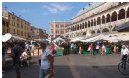
14世紀の法廷庁舎前エルベ広場は野菜・果物市場(建物1Fに肉・魚・チーズ・パールの常設店舗)