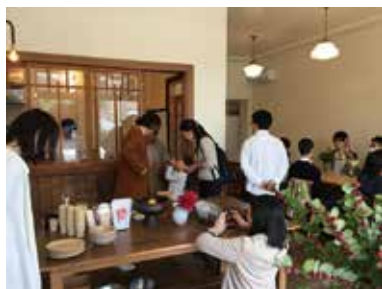
カフェの内覧会の様子

「蔵の街」と称される栃木のまちは、江戸との舟運で栄え、江戸末から明治末にかけて見世蔵を通りに構える商家が多くあった。特に、黒漆喰で仕上げた重厚な見世蔵を構えることは当時の商人のステイタスであり、今も残る見世蔵を見比べながら、時代が進むにつれ造形・技術が発展していく様を楽しむことができる。