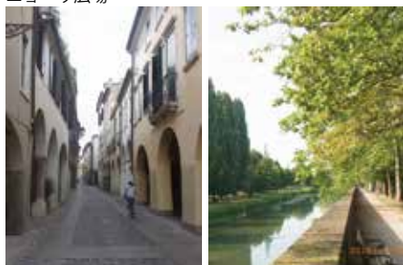
柱廊が連続する住宅街路 城壁沿いの運河の水辺緑地

また旧市街地は人と街の暮らしを守る一般車両進入禁止（ZTL）が設定されている。公共交通のトラム・路線バスや居住者駐車許可証をもつ車輛以外は進入禁止になる。狭い路幅が多く、素朴で歴史を感じる玉石舗装や石畳路を手携えて歩く高齢な人々やベビーカーの親子、学校に通う子供達、手動・電動の車椅子利用者も目立ち、全ての人々が狭い町でも伸び伸びと歩行者優先の安全安心な暮らしを確保されている。比較的自由に通行できる自転車・スクーターを筆頭とする二輪車と原付4輪（ミニ自動車）は、必然でイタリアらしい。信号による交差点は少なく、一般的には反時計回りのラウンドアバウト交差点で歩行者は絶対優先で、運転者も十分配慮している。