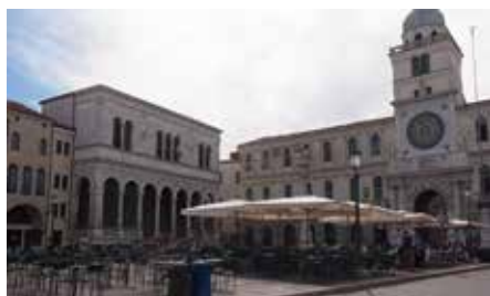
朝市が終わり午後にはオープンカフェに変身するシニョーリ広場